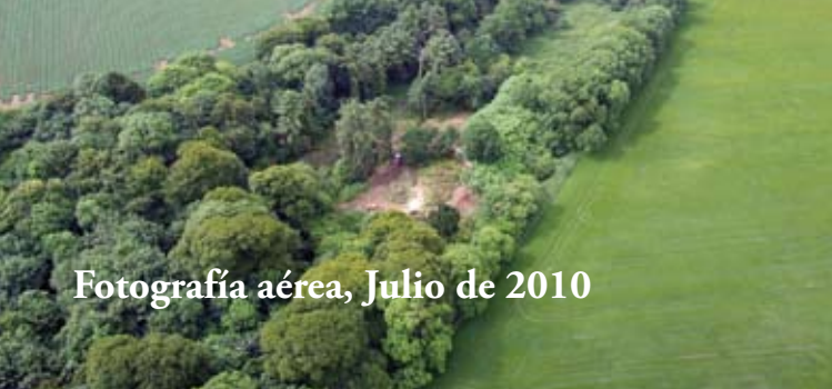
Fotografía aérea, Julio de 2010